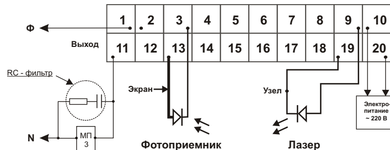
Схема подключения прибора с использованием в качестве датчика оптопары лазер-фотоприемник